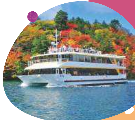
日光：中禅寺湖遊覧船