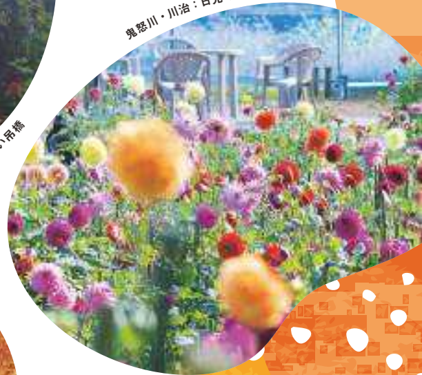
鬼怒川・川治：日光 花いちもんめ