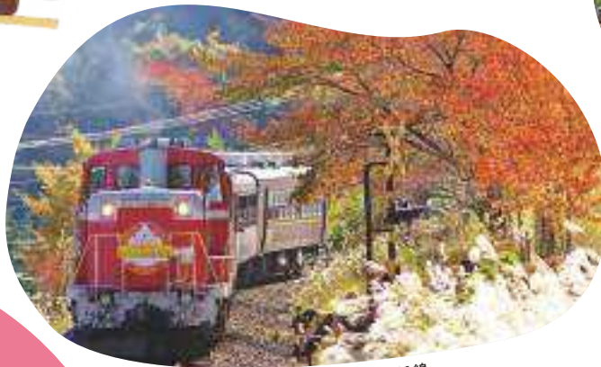
足尾：わたらせ渓谷鐵道沿線