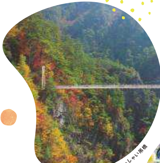
湯西川・川俣・奥鬼怒：瀬戸合峡・渡らっしやい吊橋